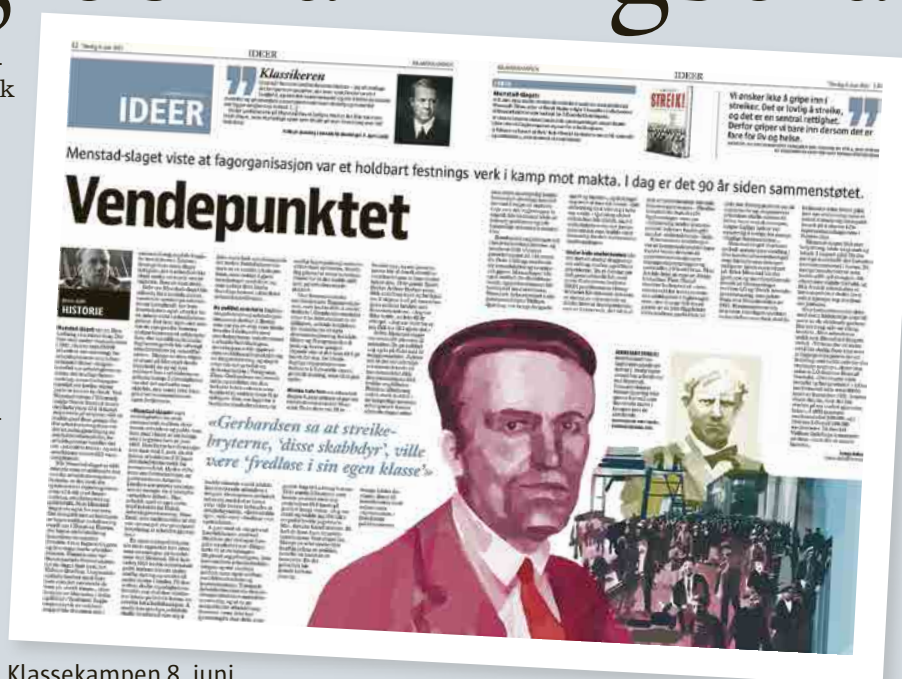
Klassekampen 8. juni