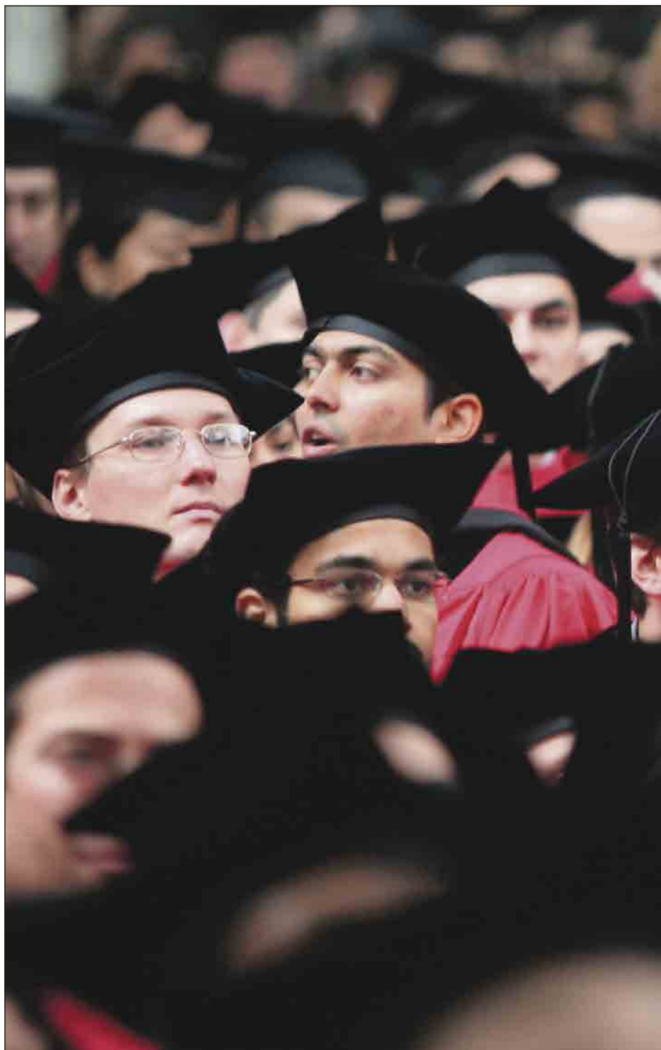
GJENNOM NÅLØYET: Disse avgangsstudentene på Harvard har gjennomført studier på komme inn, og trolig venter lange dager i arbeidslivet etter fullførte studier.

– Hvis du lever i den meritokratiske eliten, som meg, kan du se deg rundt. Studentene mine er frustrerte. For 15 år siden var de lykkeligere og fulle av forventninger til det fabelaktige livet som sto foran dem. I