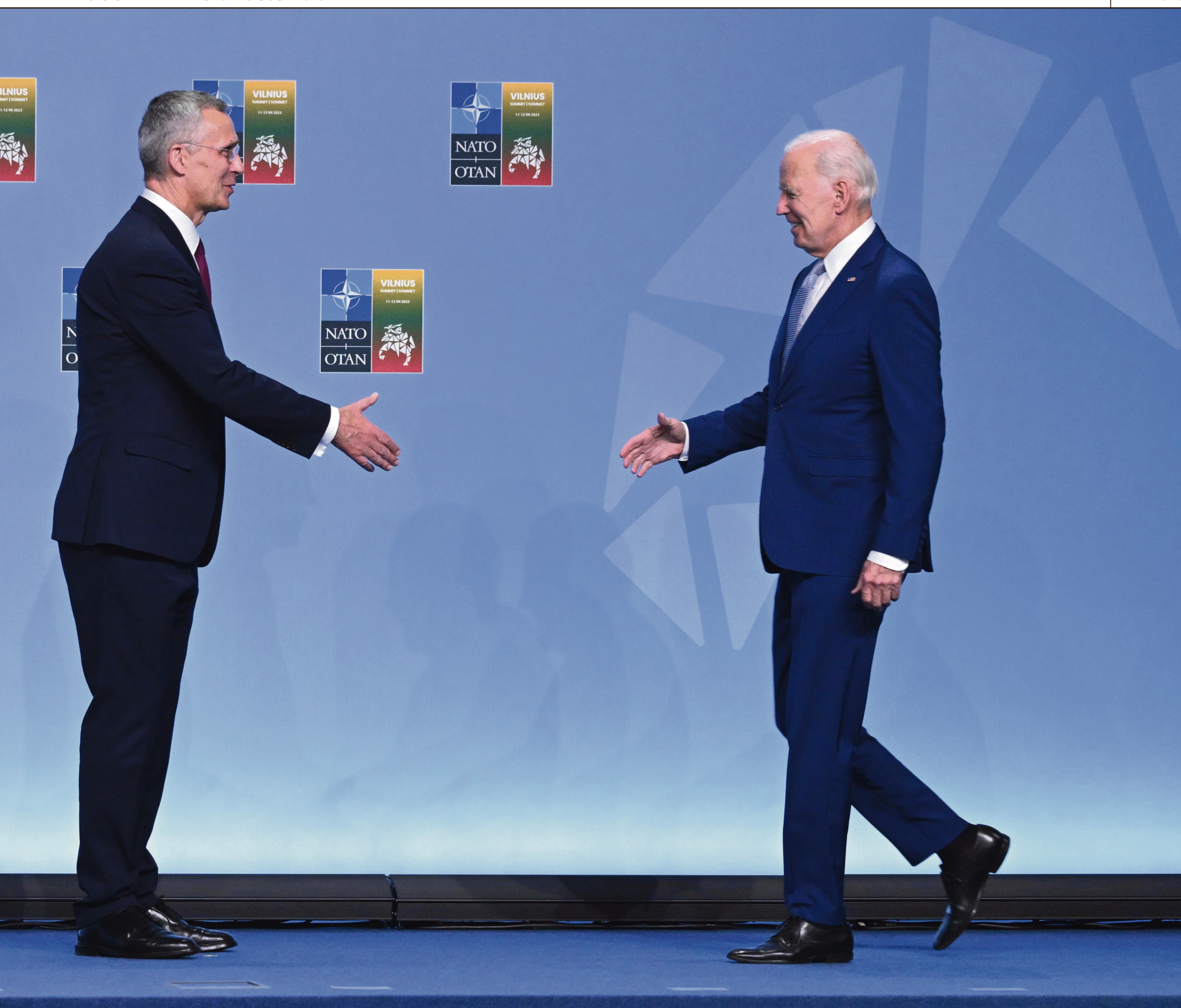
Joe Biden velkommen på Nato-toppmøtet i Vilnius i juli i år.

stor trugsmål at det kunne samantliknast med ei krigserklæring.