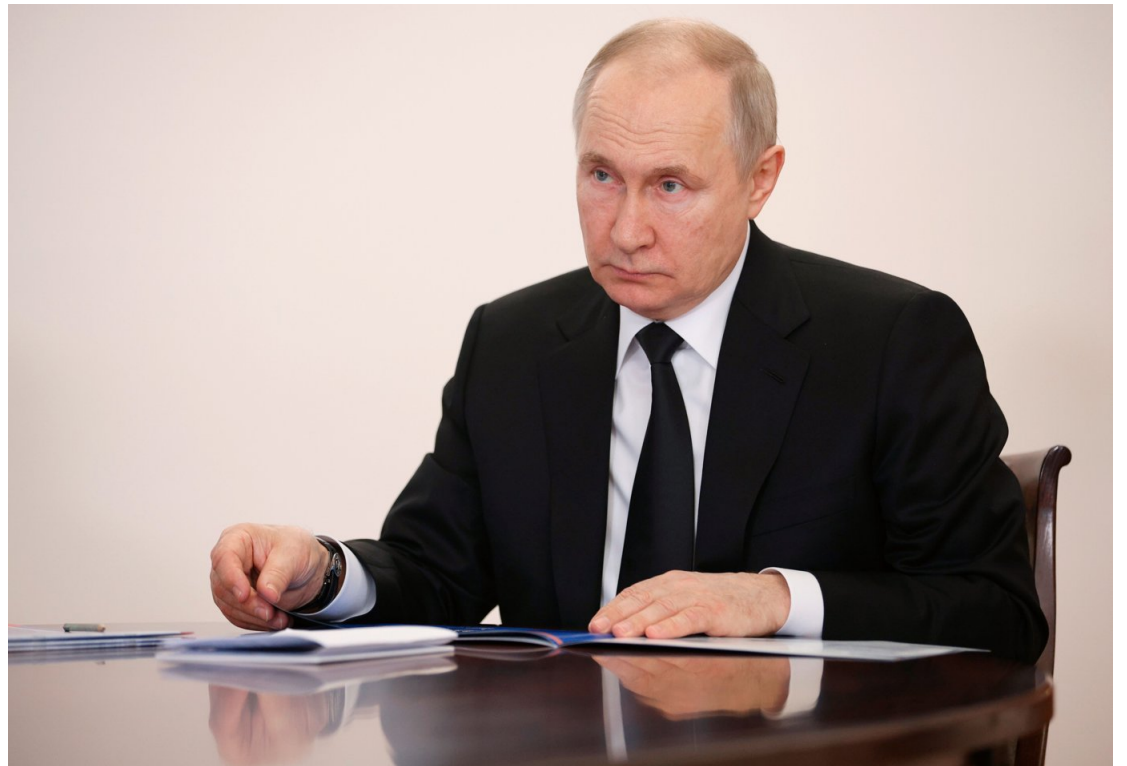
◻ - I folkets øyne er Putin en ekte tsar, etter seieren i Tsjetsjenia og annekteringen av Krym. Men manglende seier i Ukraina har underminert hans legitimitet, sier Sjisjkin.

hellige faderlandet er en øy med fiender på alle kanter. Bare den hellige tsaren kan redde Russland og dets folk fra kaos og ruin.