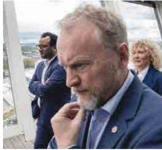
BEKJEMP ULIKHET: Og begynn hos deg selv.

Klassekampen honorerer normalt ikke innsendt stoff. Innsenderens e-postadresse blir trykt med mindre innsenderen reserverer seg mot dette.