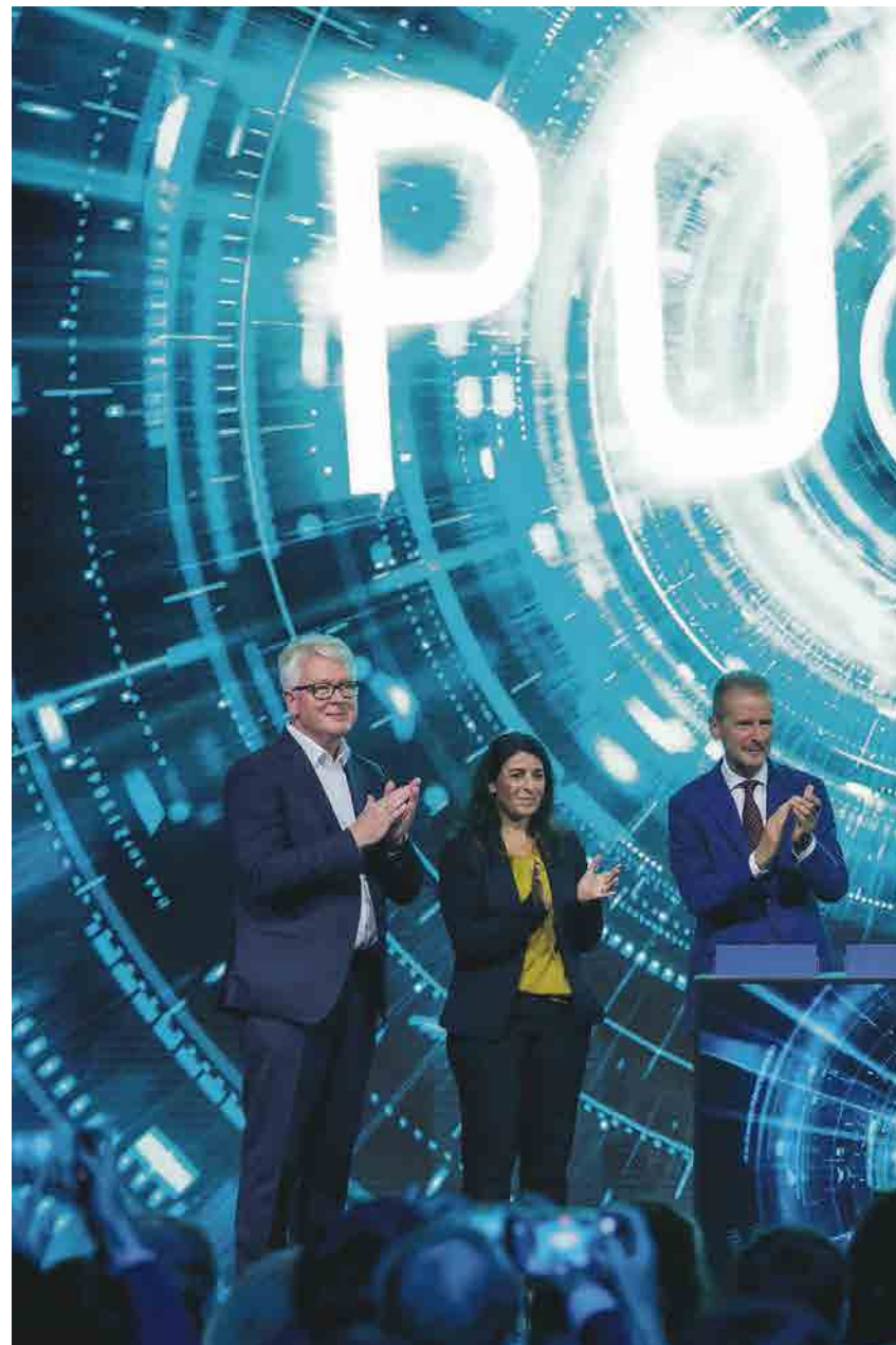
HØY SPENNING: Skyhøye ambisjoner har ført til et underskudd på kraft i Tyskland. Bilprodusenten Volkswagen, på åpningsmarkeringen for en batterifabrikk i Sachsen.

Høye ambisjoner uten tilstrekkelige investeringer har ført til et underskudd på kraft som dekkes ved import fra andre land, ikke minst Norge, med sterke virkninger på strømprisene. Tysk energipolitikk har vært å