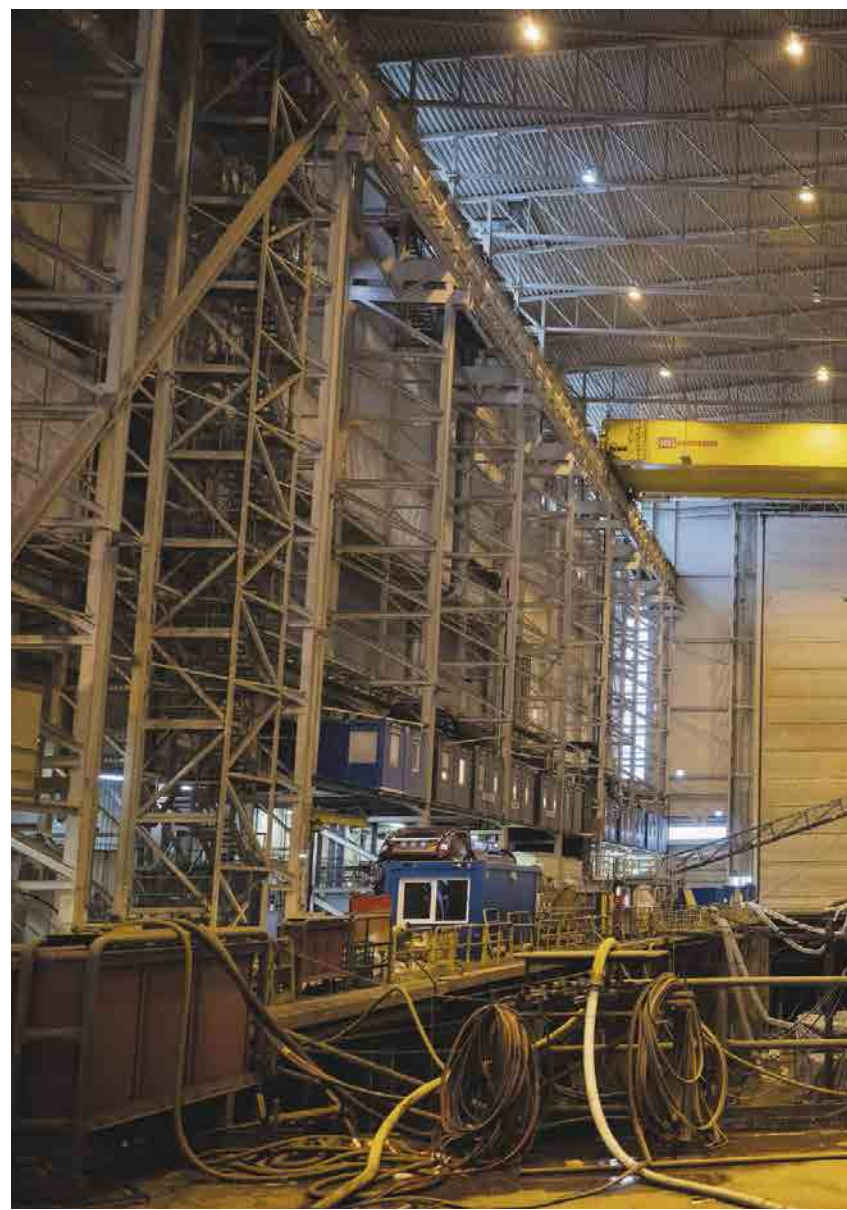
JA TIL NORMAL ARBEIDSTID: Knapt noen utenlandske arbeidere i bemannings

Det kan være sveisere, platearbeidere, industri-