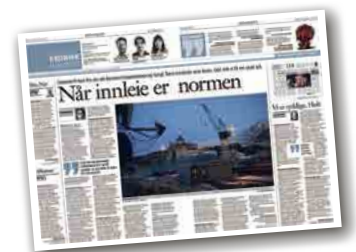
Klassekampen 26. februar

Gi aktiv og konkret oppfordring til de innleide pendlerne om å søke på jobbene de i årevis har utført. Jobbene de blir tilbudt, må være faste og 100 prosent stilling med normalarbeidsdag eller ordinært skift. De som får jobbene, kan få testet