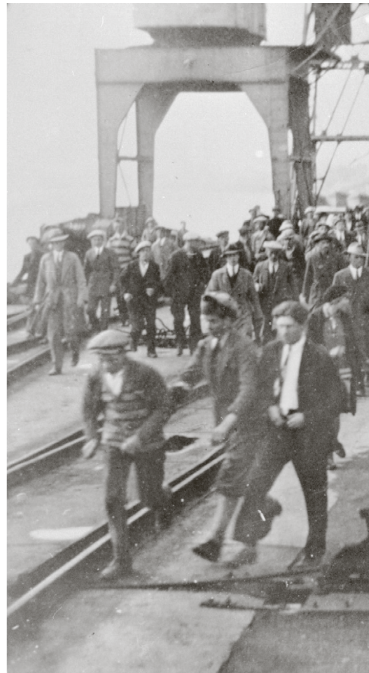
VILJE TIL STRID: Arbeidere på jakt etter streikebrytere ved Norsk Hydros kai på Menstad, 1931.