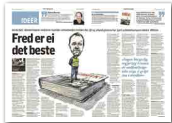
Klassekampen 4. januar

■ Samarbeidet mellom stat, LO og NHO – «den norske modellen» – har begrenset streikemulighetene, og LO har historisk sett motarbeidet ellers effektive ulovlige streiker, påpeker Berntsen i sin tekst, som Bals her svarer på.