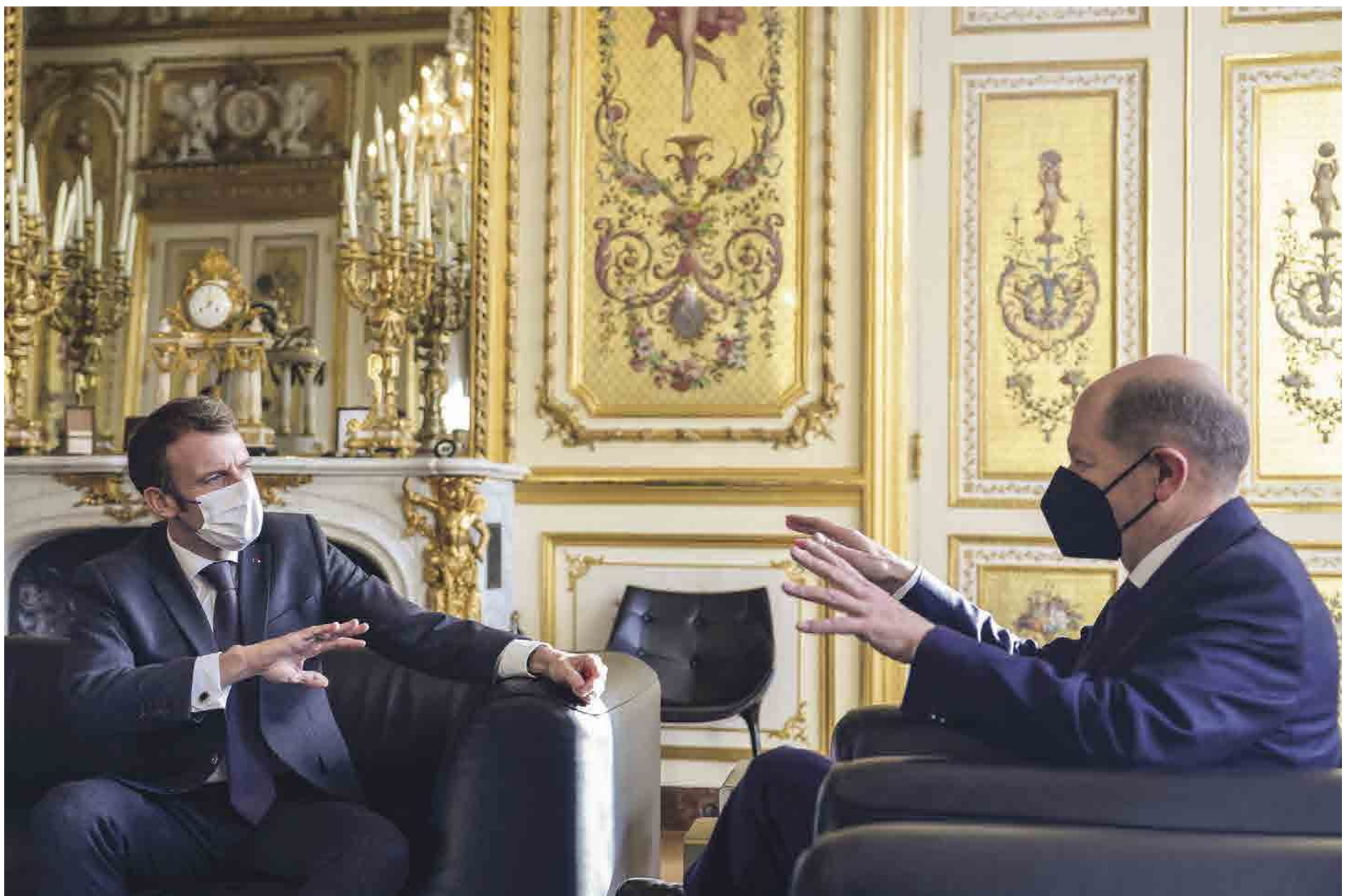
EN HÅPEFULL, EN NØKTERN: I fire år nå har Tyskland og Frankrike diskutert et fransk-tysk jagerbombefly, Future Combat Air System (FCAS). Det er imidlertid ingen hemmelighet at prosjektet har få tilhengere i den tyske politiske klassen, skriver artikkelforfatteren. Her møtes Tysklands kansler Olaf Scholz og Frankrikes president Emmanuel Macron i Paris i desember.