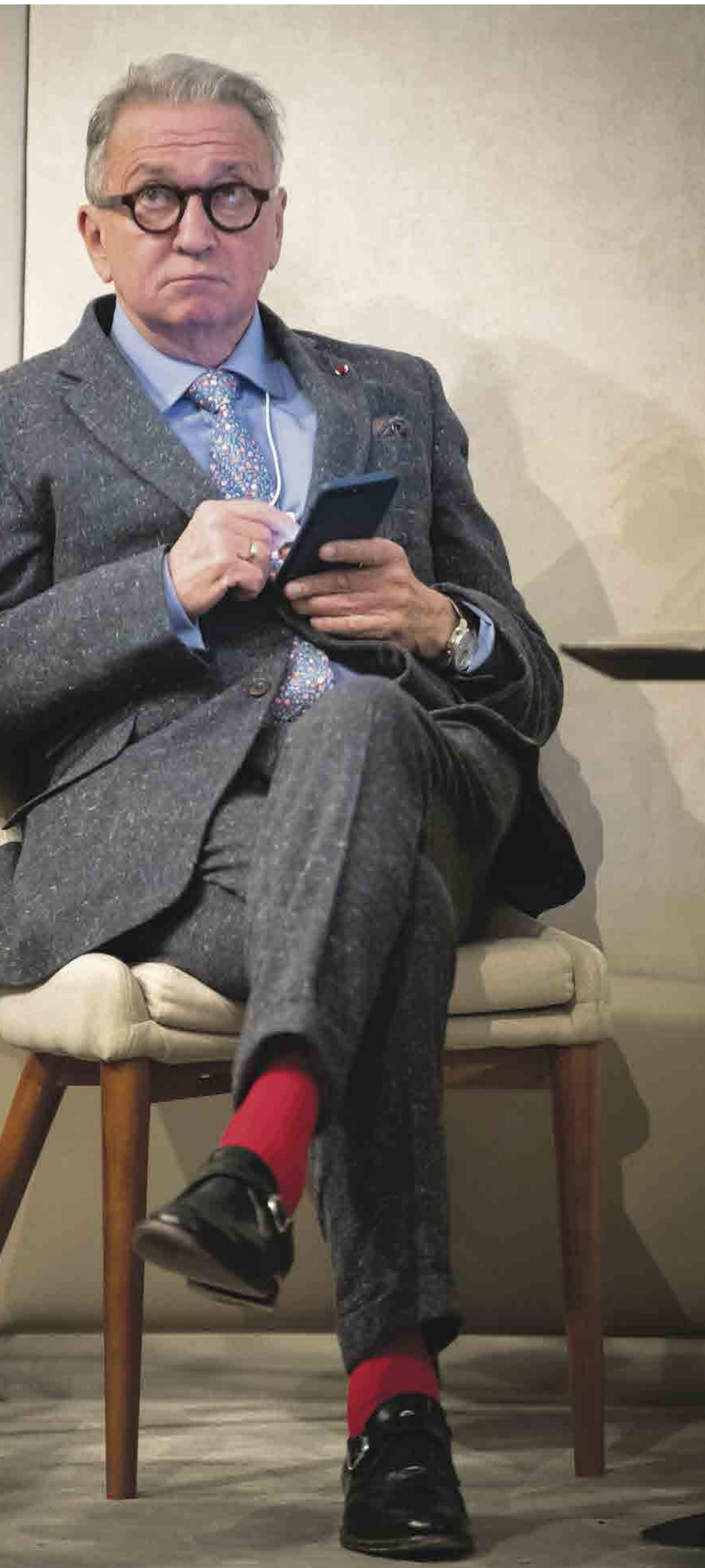
EPSTEIN-GATE OG DIPLOMATIET: Karrieren til Terje Rød-Larsen blottlegger et interessant system i norsk utenrikstjeneste og diplomati, skriver forfatteren.