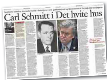
Klassekampen 11. februar

Et menneske som har kjøpesenteret som sitt naturlige oppholdssted, står i fare for å få en korrumpert sjel.