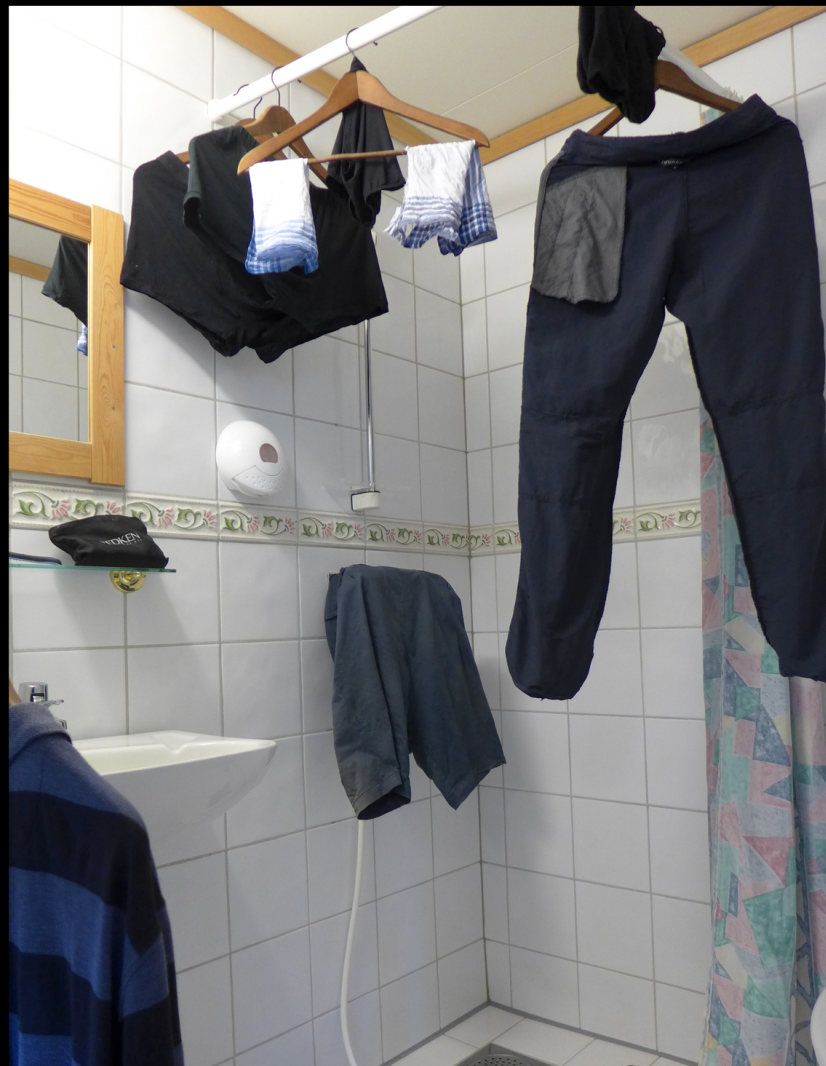
Badet på rom 26 lørdag morgen