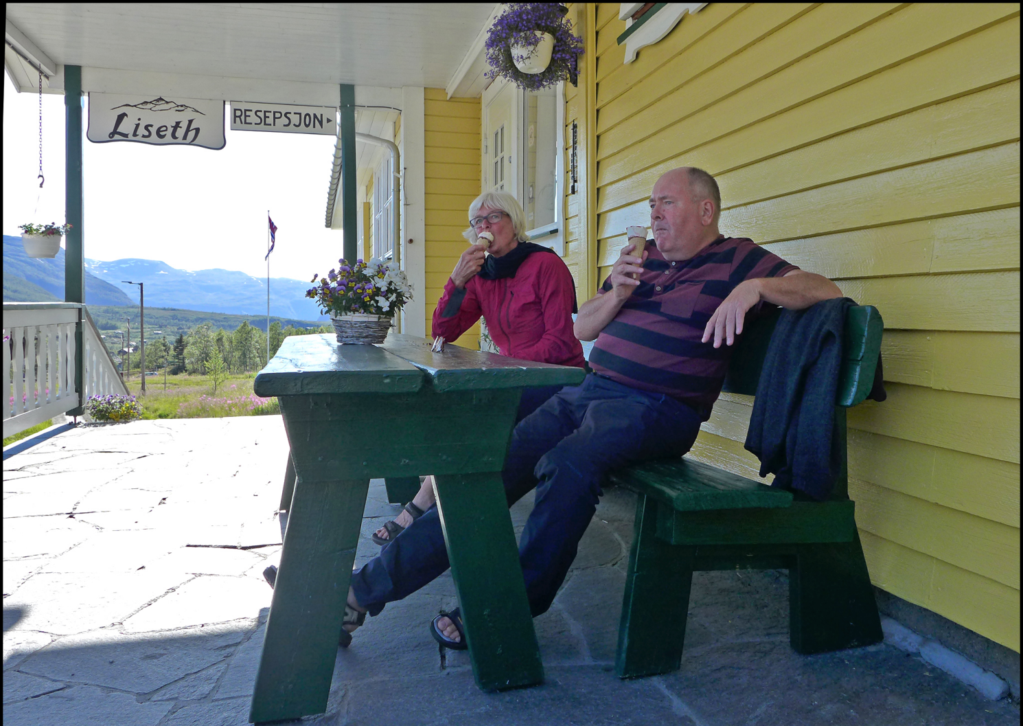
Dessert på trappa. Imorgen blir en spennende dag: Vi gjør et forsøk på å nå Dyranut til fots.