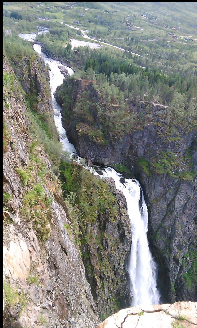
Bilde Inger tok med mobilen i går